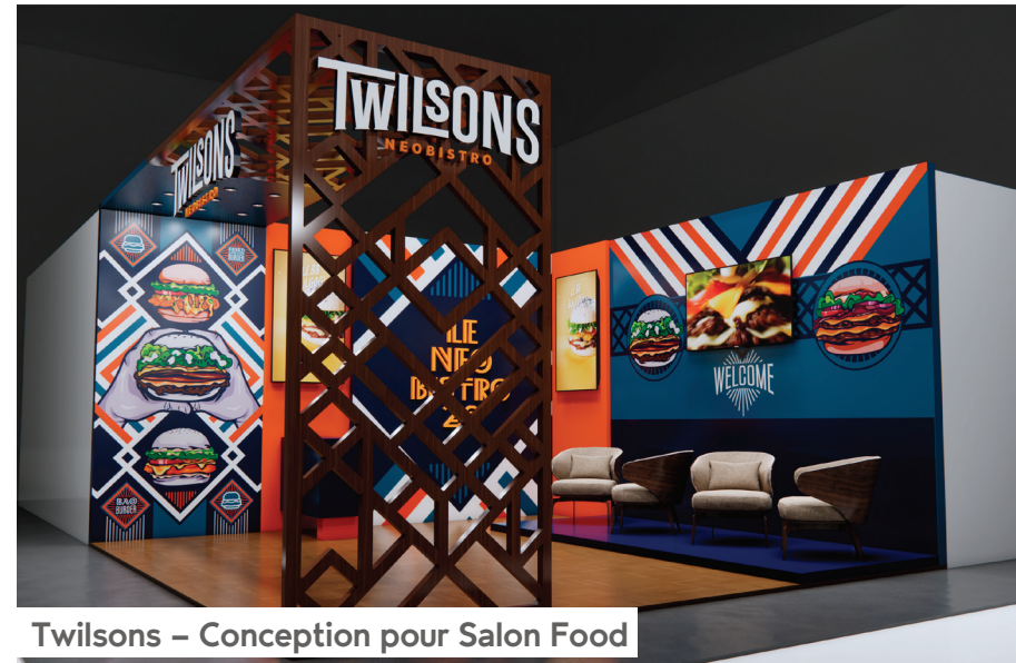
Twilsons – Conception pour Salon Food

Twilsons, une marque spécialisée dans les burgers, nous a confié la conception de leur stand pour un salon Food. Un design 3D unique a été créé spécifiquement pour la marque, afin d'attirer l'attention et de mettre en avant son identité.