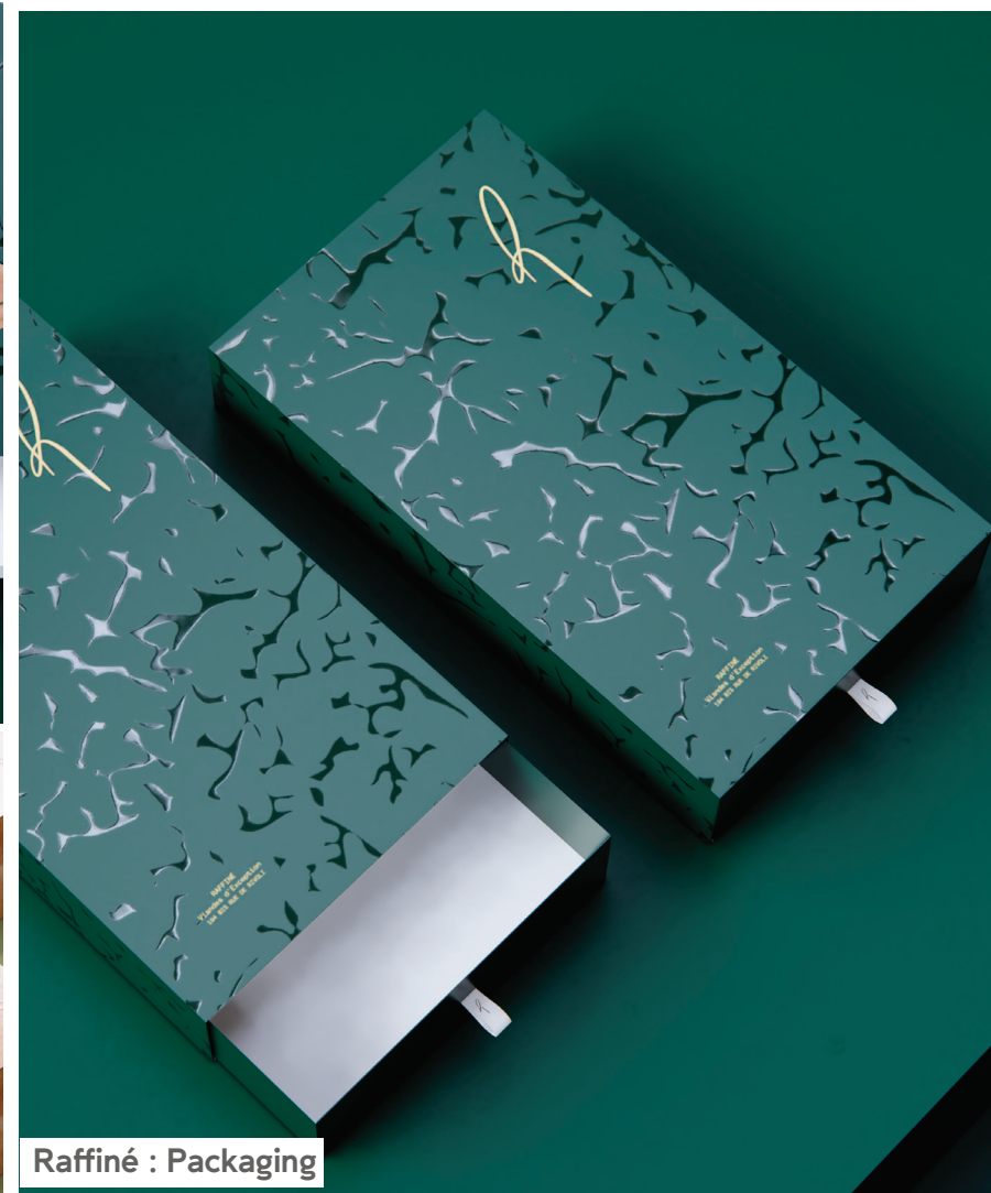
Raffiné : Packaging

Raffiné au cœur de Paris, spécialisé dans des viandes d'exception maturées. Dans une ambiance élégante, Raffiné propose une cuisine française moderne qui met en valeur la richesse des saveurs et la qualité de ses ingrédients