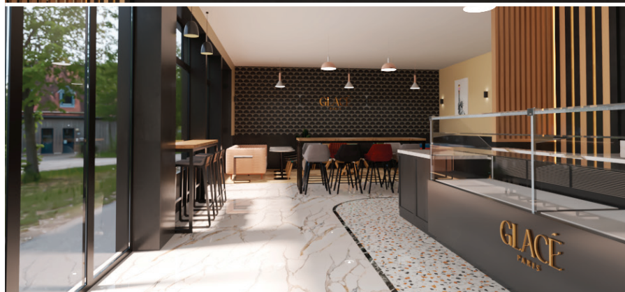
Glacé Paris – Création de Marque et Agencement 3D

Glacé Paris est un projet dédié aux glaces, conçu spécifiquement pour le marché du Moyen-Orient. Nous avons réalisé l'agencement en 3D du projet, mettant en valeur l'identité unique de la marque et offrant une expérience visuelle attrayante pour les clients