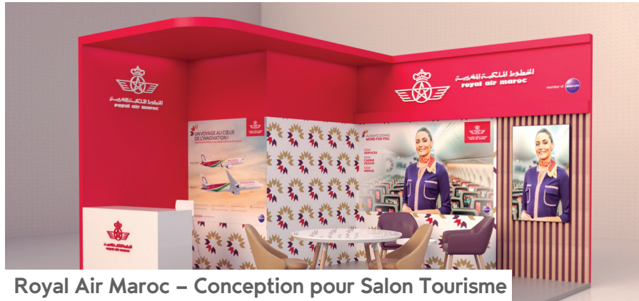
Royal Air Maroc – Conception pour Salon Tourisme

Royal Air Maroc a fait appel à nos services pour la conception de leur stand lors d'un salon dédié au tourisme. Un design 3D a été élaboré pour représenter la marque de manière dynamique et conviviale, mettant en valeur l'expérience de voyage offerte.