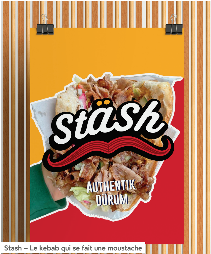
Stash – Le kebab qui se fait une moustache