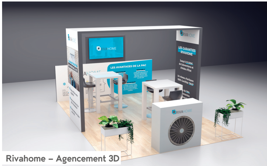
Rivahome – Agencement 3D

Royal Air Maroc a fait appel à nos services pour la conception de leur stand lors d'un salon dédié au tourisme. Un design 3D a été élaboré pour représenter la marque de manière dynamique et conviviale, mettant en valeur l'expérience de voyage offerte.