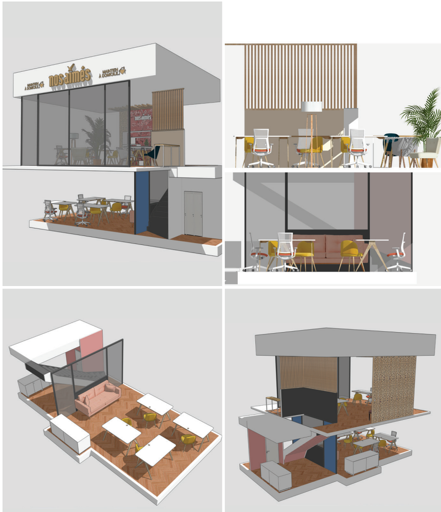
Shiva – Aménagement de bureaux

Shiva, une entreprise spécialisée dans l'aide à la personne, a fait appel à nos services pour la conception et l'agencement de leurs bureaux. Un travail de design 3D a été réalisé pour optimiser l'espace et offrir un environnement fonctionnel et moderne, adapté aux besoins de l'entreprise.