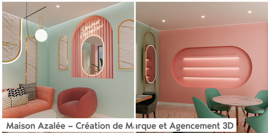
Maison Azalée – Création de Marque et Agencement 3D

Maison Azalée est une pâtisserie artisanale qui se spécialise dans des créations sucrées raffinées et élégantes. Nous avons réalisé l'agencement en 3D du projet, mettant en valeur l'identité unique de la marque et offrant un espace accueillant pour les clients, où la passion pour la pâtisserie se mêle à une esthétique délicate.