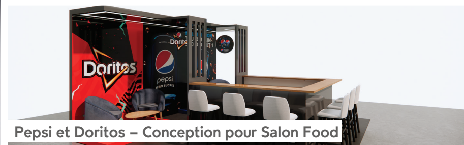
Pepsi et Doritos – Conception pour Salon Food

Pepsi et Doritos ont fait appel à nos services pour la conception de leur stand lors d'un salon food. Un design 3D a été créé pour représenter les marques de manière engageante, tout en soulignant leurs produits emblématiques.